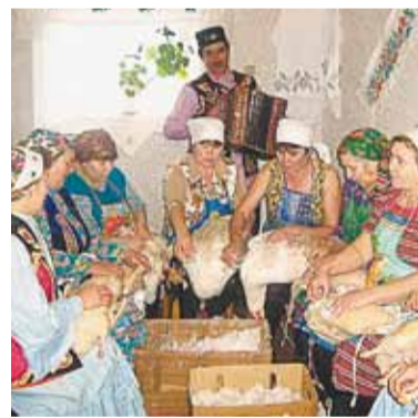
После праздника сватов засылают к самым работающим девушкам.